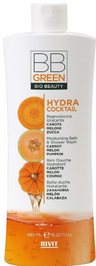
BAGNO DOCCIA IDRATANTE

COD. 09324 – 480 ML 97% NATURAL INGREDIENTS