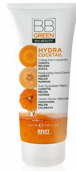
CREMA MANI IDRATANTE

COD. 09325 – 200 ML 95% NATURAL INGREDIENTS