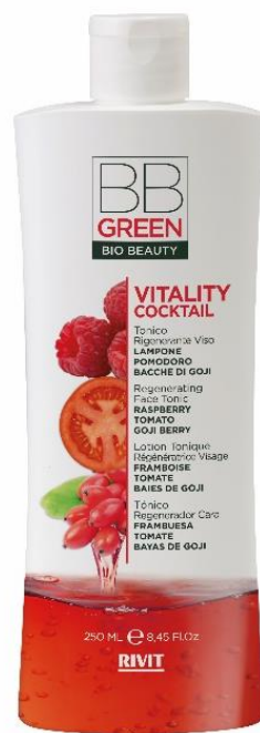
TONICO RIGENERANTE VISO

COD. 09329 – 250 ML 93% NATURAL INGREDIENTS