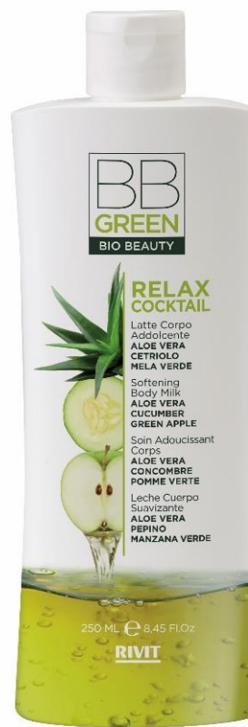
LATTE CORPO ADDOLCENTE

COD. 09321 – 250 ML 98% NATURAL INGREDIENTS