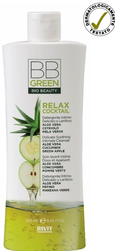
DETERGENTE INTIMO DELICATO E LENITIVO

COD. 09320 – 480 ML 97% NATURAL INGREDIENTS