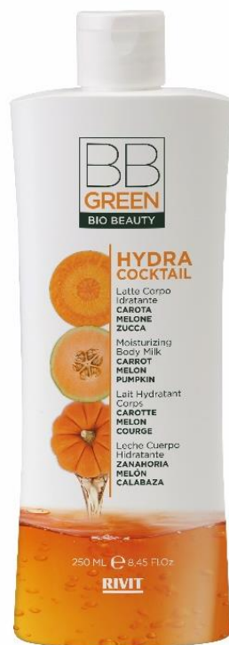
LATTE CORPO IDRATANTE

COD. 09324 – 480 ML 97% NATURAL INGREDIENTS