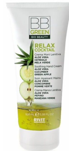
CREMA MANI LENITIVA

COD. 09322 – 250 ML 95% NATURAL INGREDIENTS