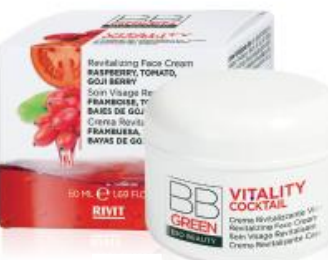
CREMA RIVITALIZZANTE VISO

COD. 09331 – 50 ML COD. 09939 – 3 ML 90% NATURAL INGREDIENTS