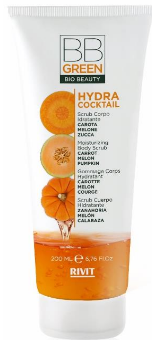
SCRUB CORPO IDRATANTE

COD. 09326 – 250 ML 95% NATURAL INGREDIENTS