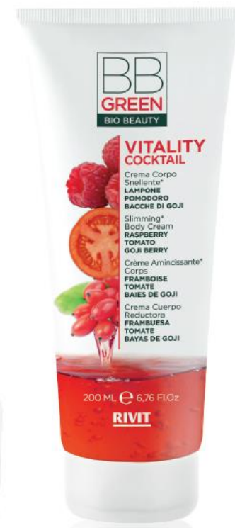
CREMA CORPO SNELLENTI

COD. 09331 – 50 ML COD. 09939 – 3 ML 90% NATURAL INGREDIENTS