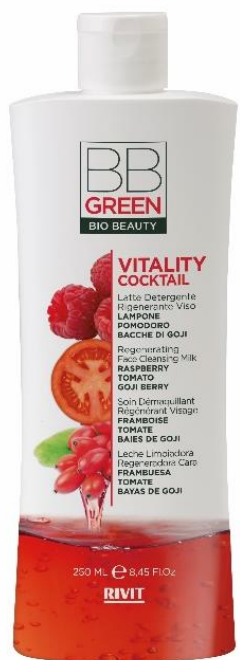
LATTE DETERGENTE RIGENERANTE VISO

COD. 09328 – 480 ML 97% NATURAL INGREDIENTS