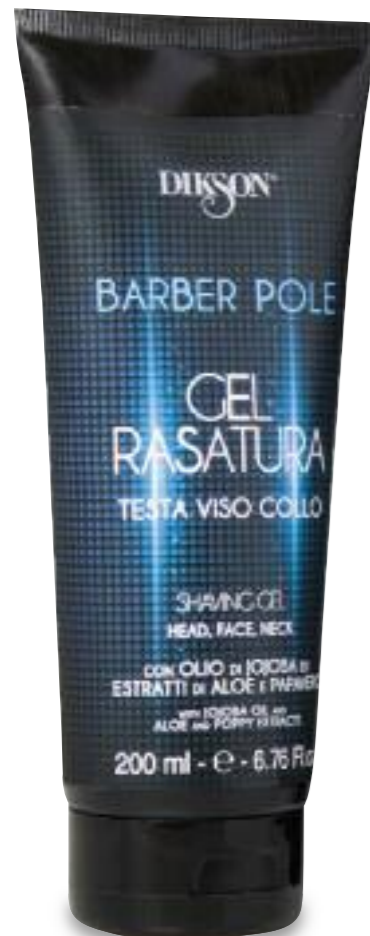
Tubo da 200 ml

con OLIO di JOJOBA ed ESTRATTI di ALOE e PAPAVERO