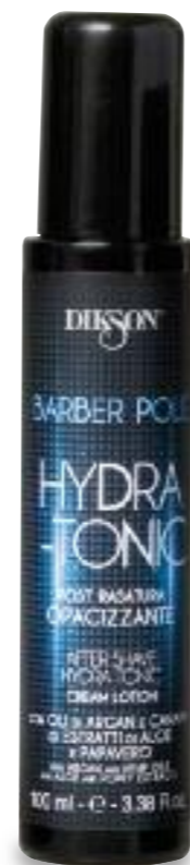
Flacone da 100 ml