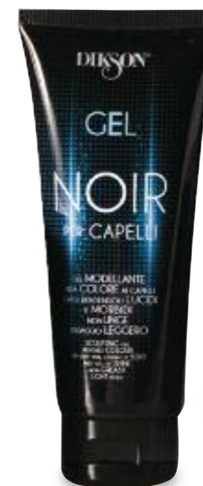
Tubo da 100 ml