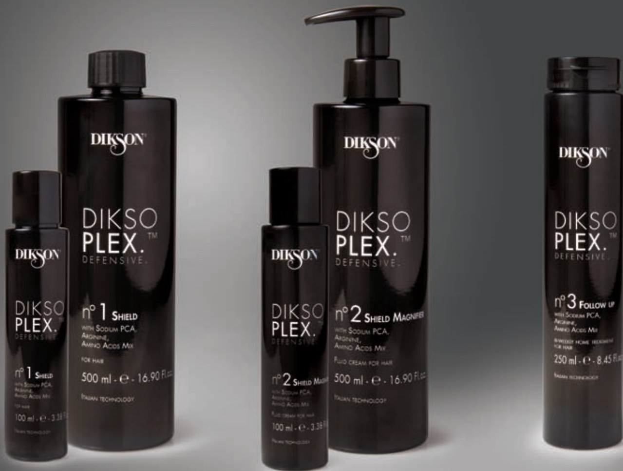
DIKSO PLEX™ DEFENSIVE 1. SHIELD 500 ml – 100 ml